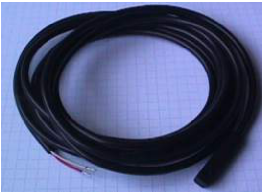
Sensor Pt1000 a 2 fios com cabo de PVC